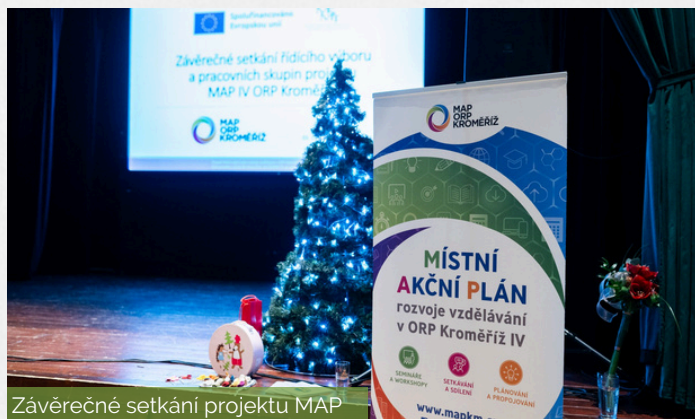
Závěrečné setkání projektu MAP

Setkání proběhlo v přátelské atmosféře a bylo krásným zakončením projektu MAP IV. Děkujeme všem členům Řídícího výboru, pracovních skupin i dalším partnerům za jejich spolupráci a aktivní zapojení.