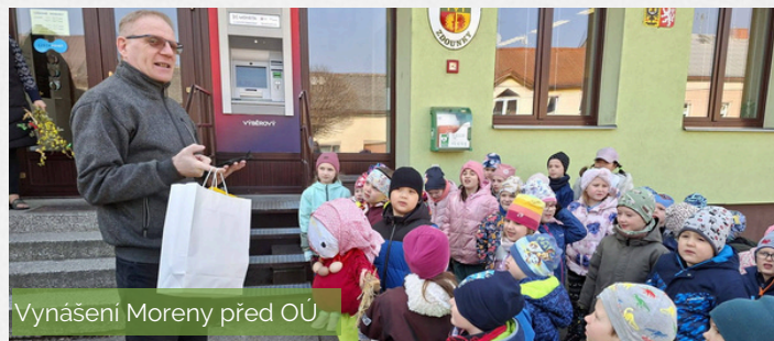
Vynášení Moreny před OÚ