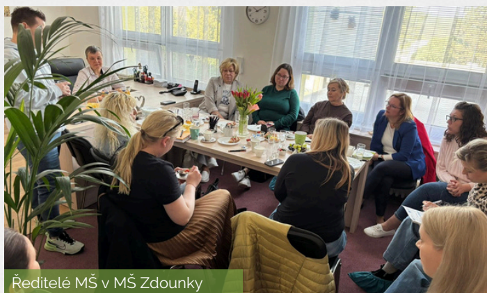
Ředitelé MŠ v MŠ Zdouanky

Děkujeme Mateřské škole Zdouanky za milé přijetí a všem paním ředitelkám a panu řediteli za inspirativní dopoledne.