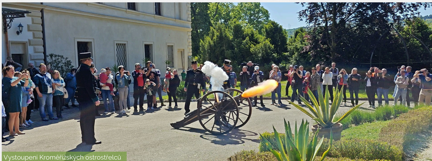
Vystoupení Kroměřížských ostrostřelců