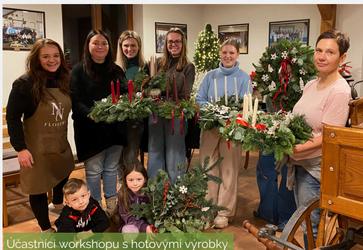
Účastníci workshopu s hotovými výrobky

Advent je dobou příprav na Vánoce a neobejde se bez adventního věnce, který je nejen symbolikou očekávání příchodu Ježíše Krista, ale také neodmyslitelnou dekorací snad všech domácností v tomto čase.