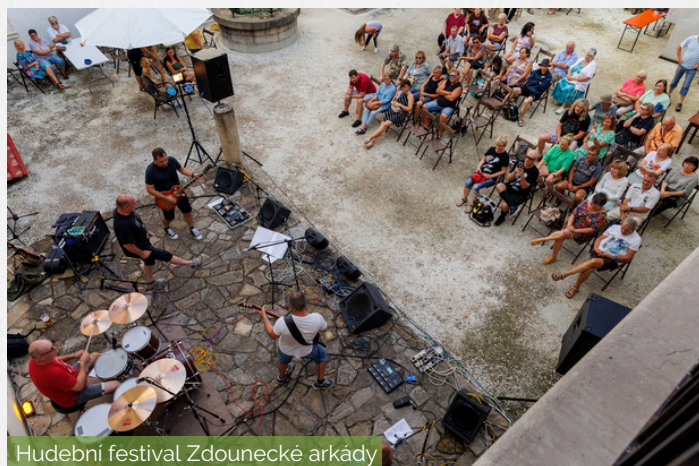
Hudební festival Zdounecké arkády