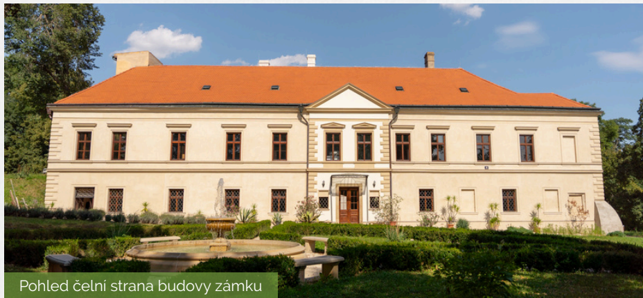
Pohled čelní strana budovy zámku

Srdce spolku je zámek Zdounky, jehož majiteli se stali manželé Vrškovi před více jak patnácti lety. Původní renesanční tvrz z 16. století, se změnila v renesanční a později barokní zámek. V minulosti zde sídlili Jezuité, hrabata z Lambergu a rod Strachwitzů , kterému byl zámek v roce 1948 zabaven a v 90. letech opět vrácen v restitučním řízení. V době před navrácením památky původním majitelům zde byl domov důchodců a na pozemcích okolo zámku např. zázemí místních myslivců. Strachwitzové nabídli zámek k prodeji.