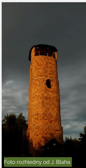
Foto rozhledny

Jaro je tady, příroda se probouzí – vezměte batůžky a vyrazte na Brdo. Z rozhledny se vám otevřou krásné výhledy na Roháče, Malou Fatru, Jeseníky, Beskydy, Vsetínské vrchy i Malé a Bílé Karpaty. Rozhledna otevírá od 1. dubna 2026.