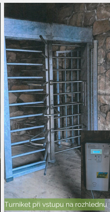
Turniket při vstupu na rozhlednu