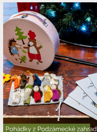
Pohádky z Podzámecké zahrady