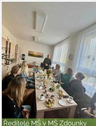
Ředitelé MŠ v MŠ Zdouanky