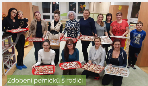
Zdobení perníčků s rodiči

Velmi si vážíme jejich zpětné vazby i ochoty spolupracovat. Díky tomu se nám daří budovat prostředí, kde se dobře cítí nejen děti, ale i jejich rodiny.