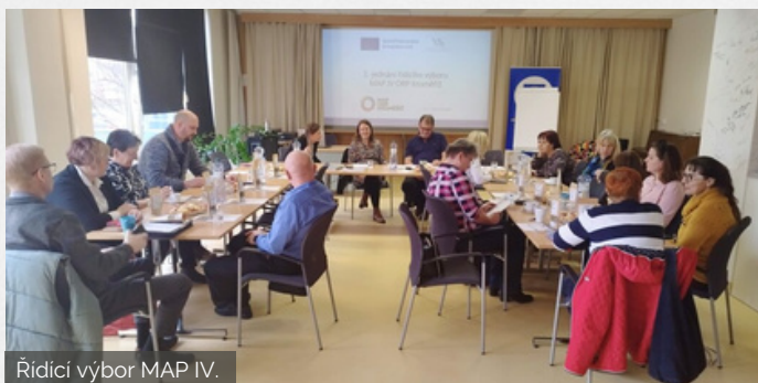
Řídicí výbor MAP IV.

Harmonogram plánovaných a již realizovaných aktivit: