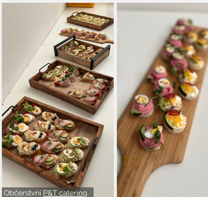
Občerstvení P&T catering.

Děkujeme všem zúčastněným za příjemnou atmosféru. Věříme, že jsou tato setkání velmi přínosná, jak pro činnost MAS tak pro obce a jejich zástupce. Za přípravu výborného občerstvení děkujeme P&T catering .